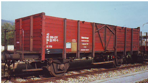
Art. Nr. 1113. Materialwagen X „Baudienst“ Epoche IV-V