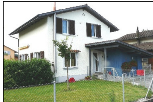
Art. Nr. 5007-B Laser-Cut Bausatz Haus Breitenstein mit Geräteschuppen

Ein nützliches Zubehör für den Anlagen-und Dioramenbau: Palettenrahmen nach SBB Norm.