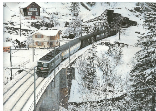
Art. Nr. 5009-B. Laser Cut Bausatz Bahnwärterhaus Standort: Obere Wattingerbrücke