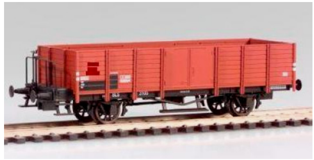
Art. Nr. 1099. Off. Güterwagen L4 ohne Bremserhaus. Epoche III Version.